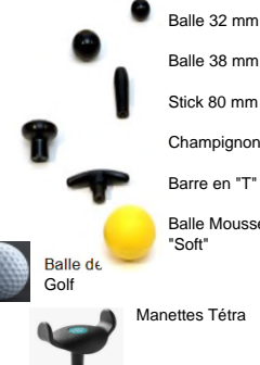
Balle 32 mm Balle 38 mm Stick 80 mm Champignon Barre en "T" Balle Mousse "Soft" Balle de Golf Manettes Tétra