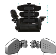
Cale troncs réglables PU