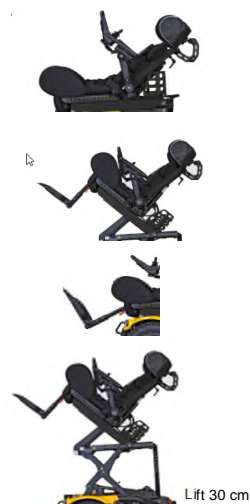
Lift 30 cm

Homologué selon Crash test ISO 7176/19 avec système d'arrimage Dahl.