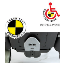
Plaque d'arrimage Dahl montée sous châssis