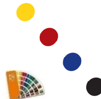
Nuancier RAL K7

Important : Le choix d'une couleur RAL personnalisée peut augmenter le délai de livraison