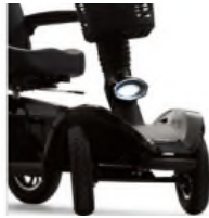
Phare avant directionnel