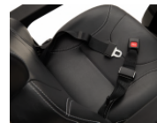
Ceinture de bassin