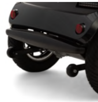
Feux arrière à LED