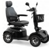
Noir métallisé intégral