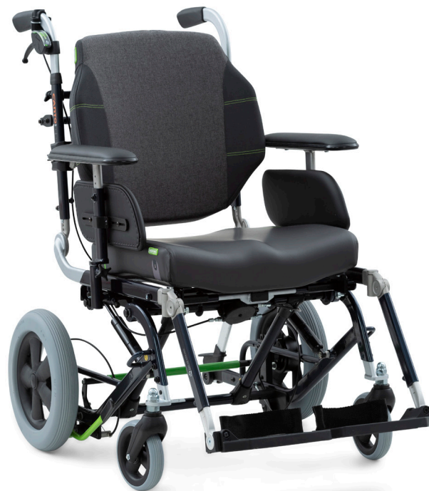
Bovenstaande afbeelding kijkt af van het basismodel.