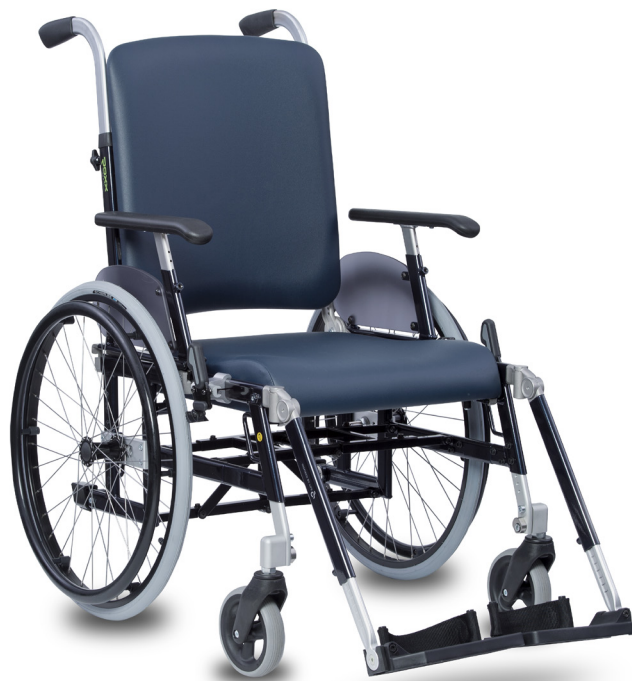
Bovenstaande afbeelding kijkt af van het basismodel.