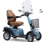
Solo Blue Diamond