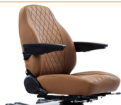
Elegance stoel Oak Brown met Diamond patroon

1 Niet mogelijk i.c.m. Elegance stoel (Oak Brown bekleding met Diamond patroon) 2 Altijd i.c.m. stevige Solo stoel indien gebruikersgewicht > 130 kg