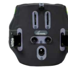
Newton Curve rugleuningen

Het zitframe wordt op de Morgan gecombineerd met het hoogwaardige Newton zitstelsel. Met de juiste zithoeken en individueel instelbare ondersteuning garandeert Newton een ontspannen zithouding voor de cliënt. Door het uitgebreide assortiment Newton Curve rugleuningen en Newton Contour zittingen bieden we voor een grote gebruikersgroep een passende ondersteuning.