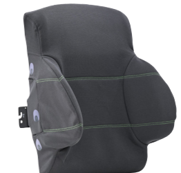
Newton Curve 3 Deep

Bij een forse kyfotische curvatuur is de Newton Curve 3 Deep de juiste oplossing. Hiermee kan de cliënt zijn of haar rug dieper laten wegzakken in de rugleuning. De Curve 3 Deep is op de Morgan serie standaard uitvoerbaar in een rugbreedte die één maat smaller is dan de maatvoering van de zitting.