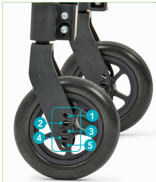
Front fork position