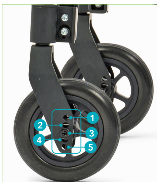
Front fork position