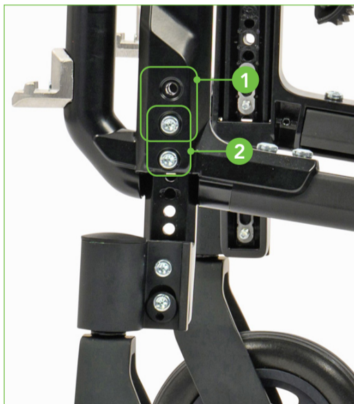
Front module position