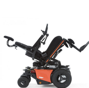
Zithoekbereik: 0° - 50°