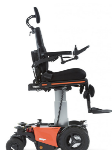
Zithoogte: 55 - 95cm