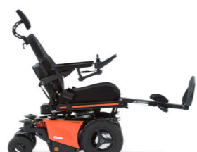
Rughoek en Beensteunverstelling