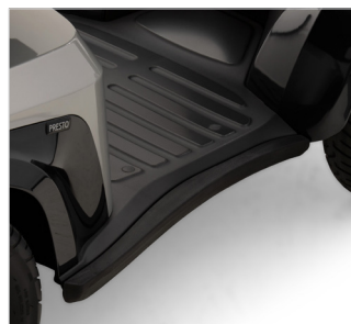
Rubber impact bumpers rondom